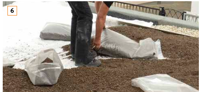
6 Vegetationssubstrat direkt auf dem Filtervlies verteilen ...