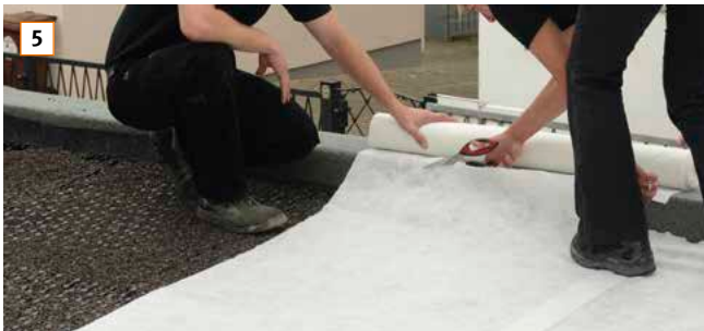
5 Filtervlies lose mit Überlappung von mindestens 10 cm auf dem verfüllten Retentionselement verlegen.