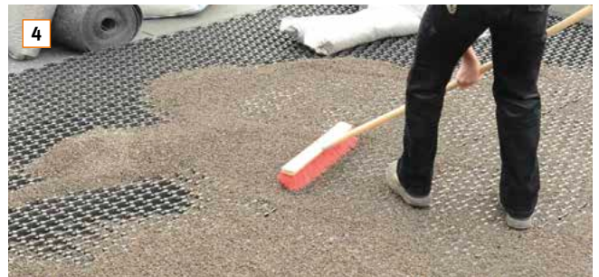
4 Im Anschluss wird das Retentionselement BauderGREEN RE 40 vollflächig mit BauderGREEN Mineraldrän BS verfüllt. Empfehlung: mit Besen verteilen und oberflächenplan abziehen.