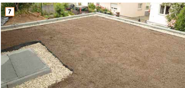
7 ... und das Substrat vollflächig ca. 5 cm stark aufbringen.