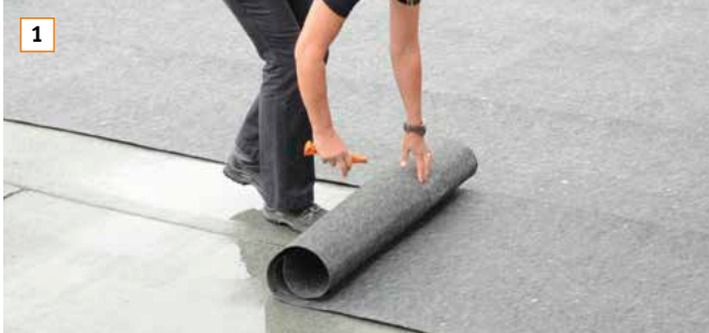
1 Faserschutzmatte BauderGREEN FSM 600 lose mit Überlappung von mind. 10 cm verlegen. Punktlasten und direkte UV-Belastung sind zu vermeiden.