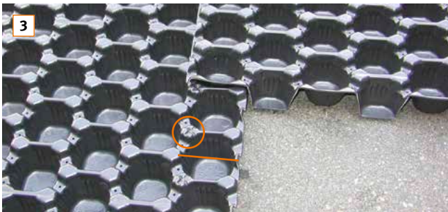
3 Für eine passgenaue Überlappung sind die äußeren Noppen von RE 40 auf einer Längsseite der Platte verbreitert. Die verbreiterte Noppenreihe ist mit einer Kreuzmarkierung gekennzeichnet.