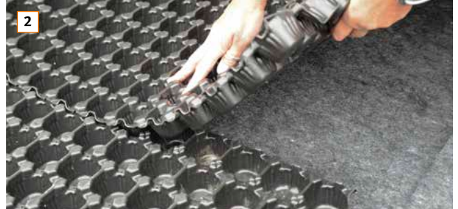
2 Retentionselement BauderGREEN RE 40 auf der Schutzlage mit einer Noppenreihe überlappend verlegen.