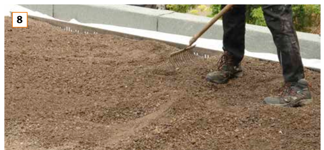
8 Anschließend mit dem übrigen Substrat Bereiche bis 15 cm Substrathöhe modellieren. Hier können später weitere bienenfreundliche Pflanzen, die mehr Wurzelraum benötigen, ergänzt werden.